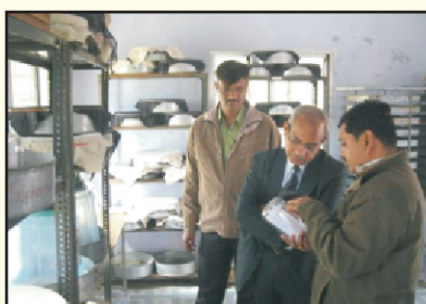
BIO CONTROL LAB